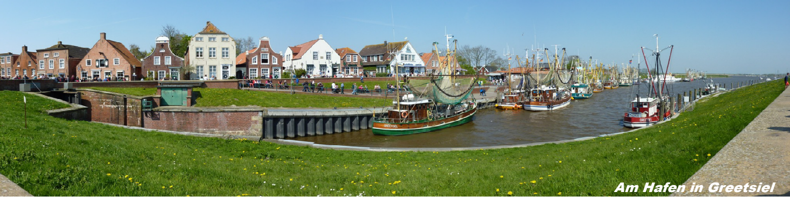
Am Hafen in Greetsiel