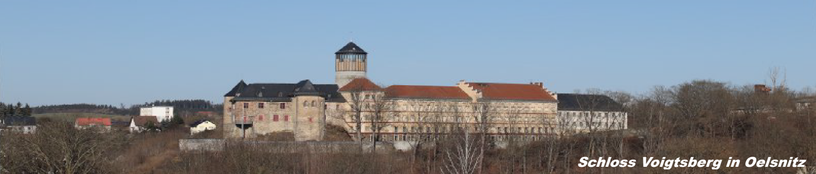
Schloss Voigtsberg in Oelsnitz